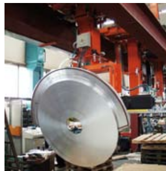
Im Automatikbetrieb für das Kommissionieren