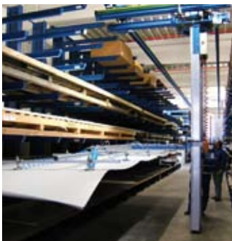
Hängebahn mit starr geführtem Hubsystem für die Plattenentnahme aus einem Regal