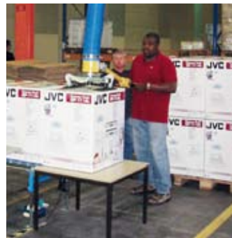
Beim Kommissionieren von Kartonnagen im Logistikbereich