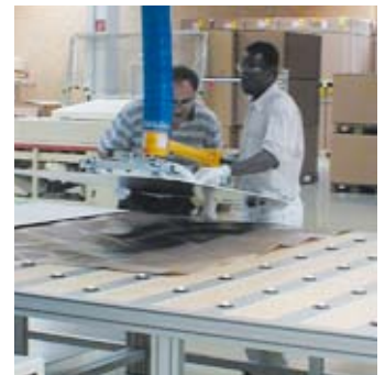
Schonende Handhabung von Solarglas-Elementen