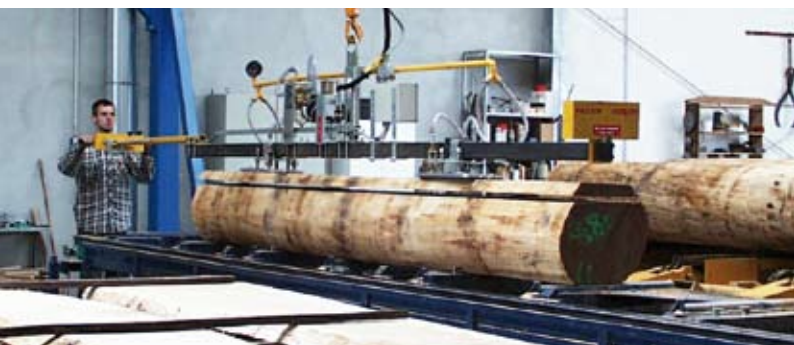
Abnehmen einer Bohle nach dem Sägen