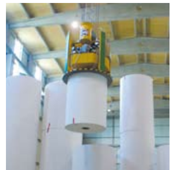
Der VacuCoil beim Einsatz im Logistikbereich einer Papierfabrik