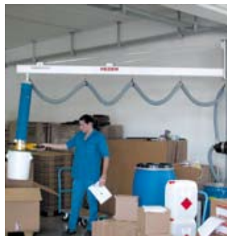
Leichtgängiger Säulenschwenkran mit Alu-Schienen-system