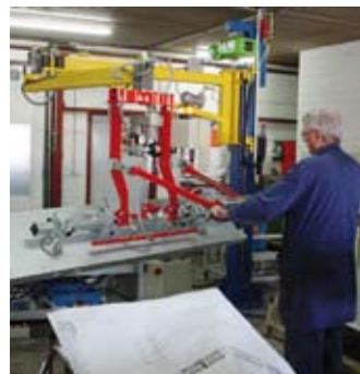
Knickarmausleger VacuMat beim Beschicken eines Fördersystems