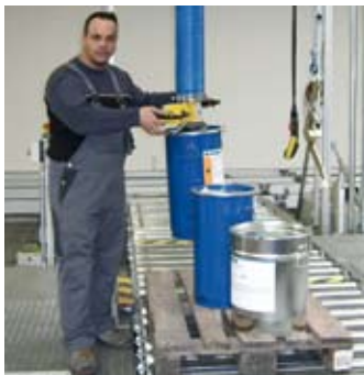
Bestens geeignet für die Handhabung von Fässern