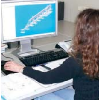
Unsere qualifizierten Entwicklungsingenieure erarbeiten innovative Lösungen – unterstützt durch moderne CAD-Systeme