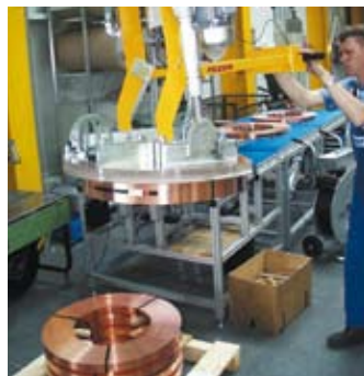
Effizientes Handling in der Kabelindustrie