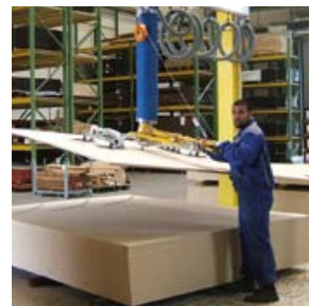
Handhabung von großflächigen Spanplatten