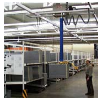
Hängebahnsystem mit Schlauchheber VacuPowerlift