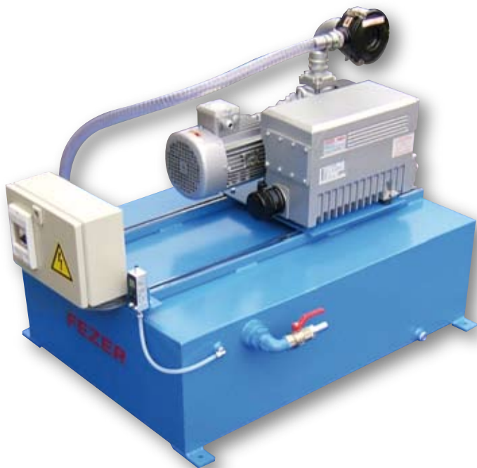
Vakuum-Energieeinheit: Sicherheitsspeicher mit aufgebautem Vakuumherzeuger