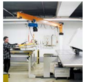
Wandschwenkran mit Vakuum-Handhabungsgerät beim Beschicken einer Stanzmaschine