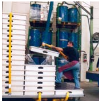
Abstapeln von Verschalungselementen