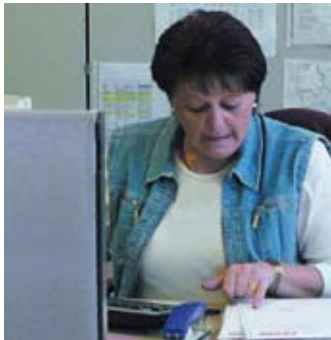
Fezer ist Ihr kompetenter Partner – das spüren Sie schon beim ersten Beratungsgespräch

Leistungsfähige, qualitativ hochwertige Produkte plus überragende Service-Leistungen plus kompetente, partnerschaftliche Beratung – das ist Fezer. Als führendes Unternehmen auf dem Gebiet der Vakuum-Handhabungstechnik genießen wir weltweit einen ausgezeichneten Ruf. Seit mehr als 50 Jahren.