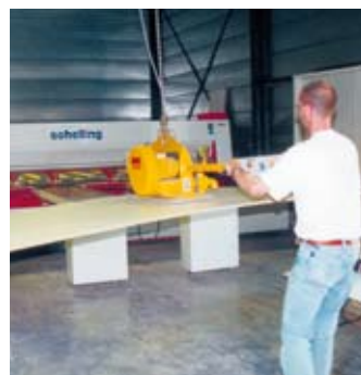
Beschicken einer CNC-Bearbeitungsmaschine