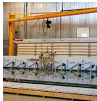
Säulenschwenkkrane mit schwenkbarem Handhabungsgerät VacuBoy