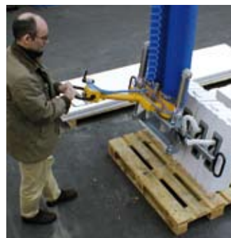
Der VacuPowerlift beim Palettieren von Porenbetonsteinen