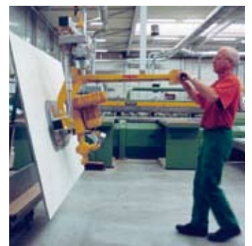
Entnahme einer Spanplatte aus dem stehenden Lager