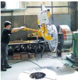
Bei der Abnahme der Coils vom Haspeldorn